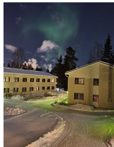
Wohnheim in Rauhalhti

Ich habe für zwei Semester Pharmazie auf Englisch studiert. Da mir keine Kurse angerechnet wurden, war ich komplett frei in meiner Kurswahl und konnte Master-Kurse belegen, die mich wirklich interessieren. So habe