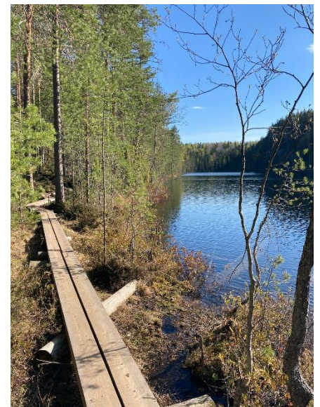
Nationalpark Southern Konnevesi

Neben den ganzen Unternehmungen in Kuopio hatte ich auch die Möglichkeit, Finnland und Umgebung zu erkunden. So unternahm ich mit Freunden zahlreiche Wochenendausflüge in nahegelegene Städte und Nationalparks. Anfang Dezember nahm ich an einer von ESN (Erasmus student network) organisierten Reise nach Lappland teil, wo ich neben Hundeschlitten-Safari, Eisfischen und einem Trip nach Tromsø spektakuläre Polarlichter und die Polarnacht erleben durfte. Im Sommersemester wurde von ESN ein Ausflug zu den Lofoten in Norwegen angeboten, an welchem ich ebenfalls teilnahm. Die tollen Landschaften, die ich dort sehen durfte, waren die lange Busfahrt und das winterlich nasse Wetter Ende April definitiv wert.